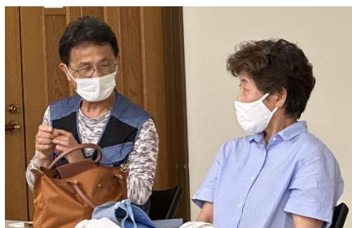
7月度例会 第一部作品相互アドバイス