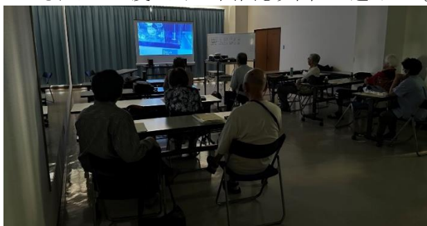
7月度例会 第一部作品発表