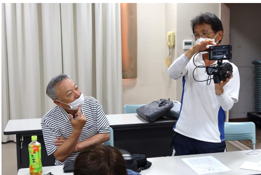
ソニービデオカメラにつけて使用・・・明るい屋外でもOK