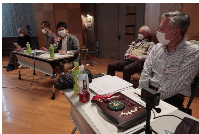
NHK織田映像取材ディスク、井碩映像制作ディスク両氏からの講評を頂く