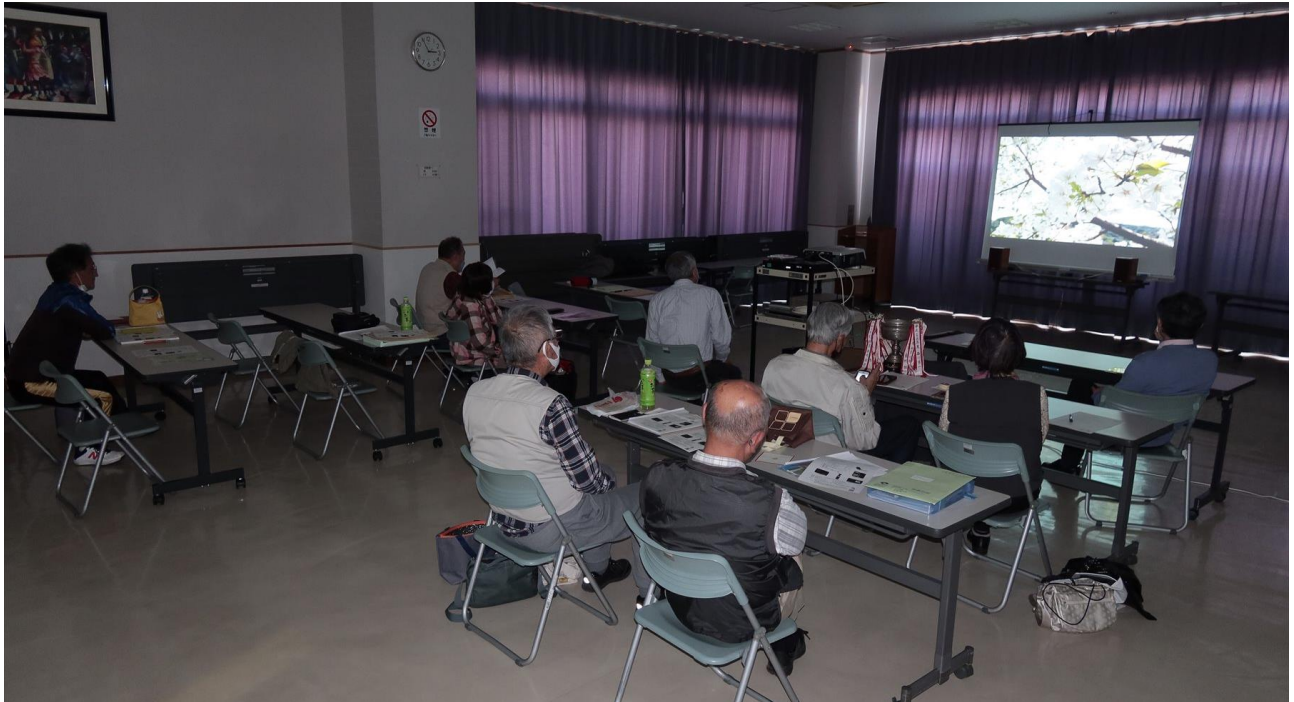
4月度例会 第一部作品発表