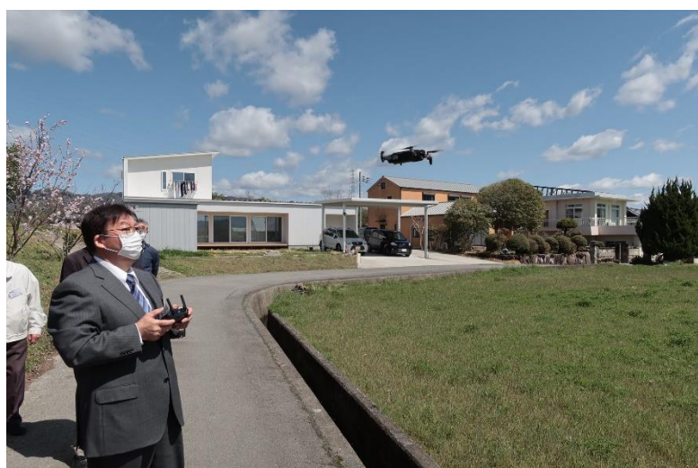
森会長のドローン実技