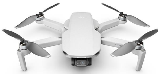
DJI Mini 2