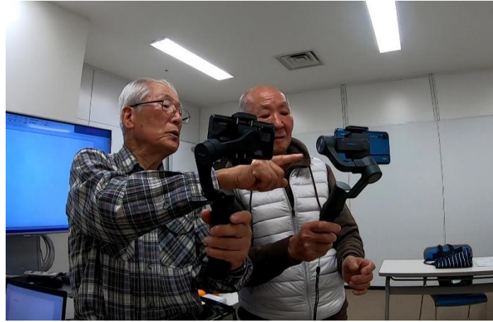
スマホとジンバル情報交換