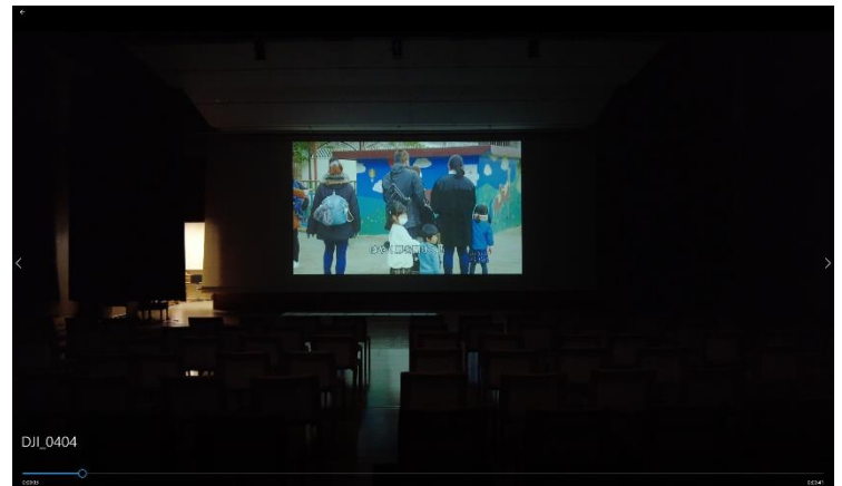
最後列から見たスクリーンの大きさ